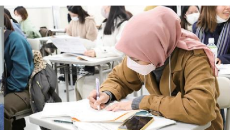
かえり くり返し勉強できる