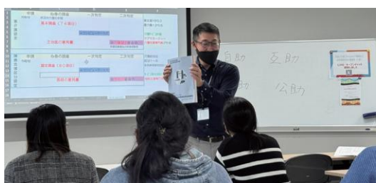
がくしゅう 学習ポイントがわかる