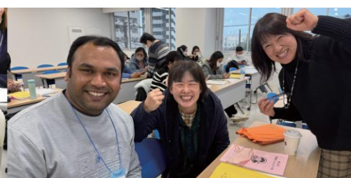
なかま 仲間ができる

たいしょうしゃ けんそく いか ようけん み もの 対象者 原則、以下の要件をすべて満たす者